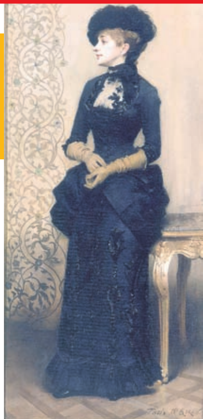
Творба на Шарл Жирон - "Жената с ръкавици", наричана "Парижанката"

"Освен залата с българските творби, които са били представени в Париж, особен интерес представлява портретът на знаменитата френска актриса Сара Бернар" - обясни Александра Дас-