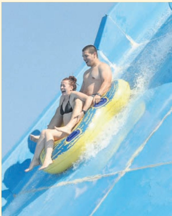
Така влязохме в лятото и...

Уважаеми читатели, навлизаме в сезона на ниските температури, късите дни, гъстите мъгли и смръщено настроение. Докторите предлагат лекове много, но смехът и 24-каратовите емоции си остават най-евтиният и ефективен начин да погъделичкаме намръщените делници. Затова ви каним да споделите усмивките си с нас. Изпратете ни снимки на info@health.bg - весели, закачливи, позитивни, любопитни, разтоварващи, широко засмени. Ние ще ги включим в нашия "Стоп кадър" с надеждата, че ще стопираме потиснатото настроение и по смръщено небе на зимното битие ще прокараме топъл лъч оптимизъм.