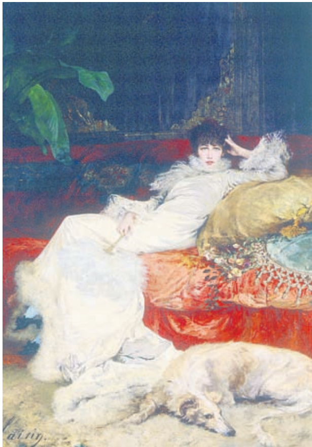
Портрет на прочутата френска актриса Сара Бернар от Жорж Клерен