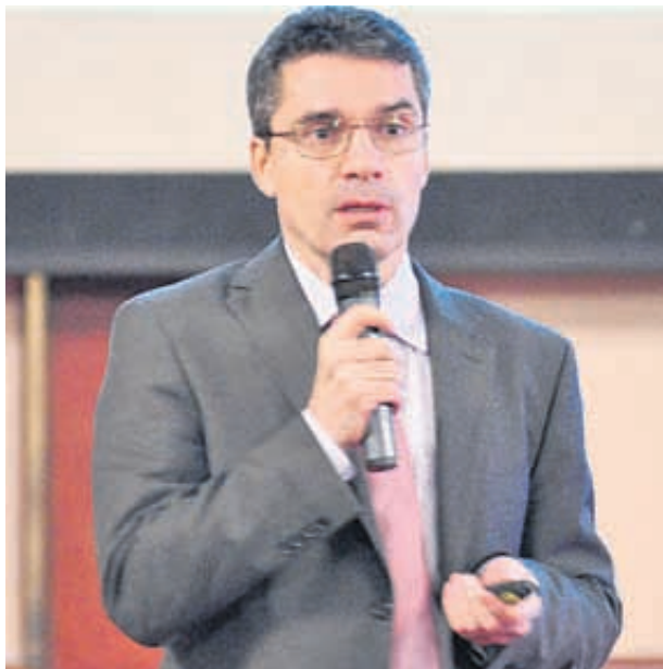
Мениджърът на IMS Health за България обяснява актуалните тенденции на лекарствения пазар у нас пред VII маркетингова конференция за фармацевти

- и легалният, който е право на търговците на едро, и нелегалният - от аптеките. Легалният расте, защото за търговците на едро това е нетна писта за печалба - спестяват разходи за транспорт, за персонал. Заради липсата на национален подход в системата на здравеопазването и в частност на лекарствоснабдяването търговците на едро отчитат 0,3% нетна доходност на година.