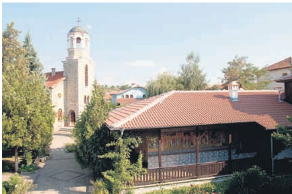
В манастира на отец Боян Саръев „Св. Успение Богородично“ в Кърджали се намира единствената в България частица от Светия кръст, а също и мощи на други светци

- Българите ходим масово на църква на Великден, Коледа и останалите големи християнски празници. Вяр-