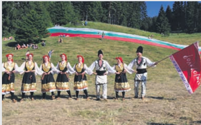
Роженските поляни отвориха обятията си за стотици хиляди почитатели на родните традиции