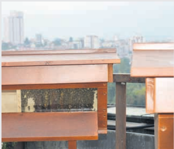
НДК се включи в уникалния проект за опазване на пчелните популации „1 000 000 кошера“, като постави на терасата на двореца кошери от системата "Top Bar", която все още е сравнително слабо позната у нас