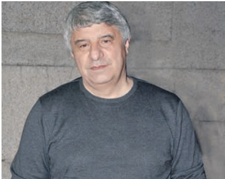
Проф. д-р Пламен ПАВЛОВ, академик на БАНИ

Големият глад от есента на 1946 г. е най-тежкото изпитание за българското население в Бесарабия не само след края на Втората световна война, а и на практика през цялата му история след преселването в Северното Причерноморие - за някои селища преди повече от 200, за други преди около 180 или 150 години. Настъпилният глад е причинен както от неблагоприятните природни фактори, които са в продължение на 1944, 1945-1946 г., така и от без преувеличение престъпната аграрна политика на съветските власти.