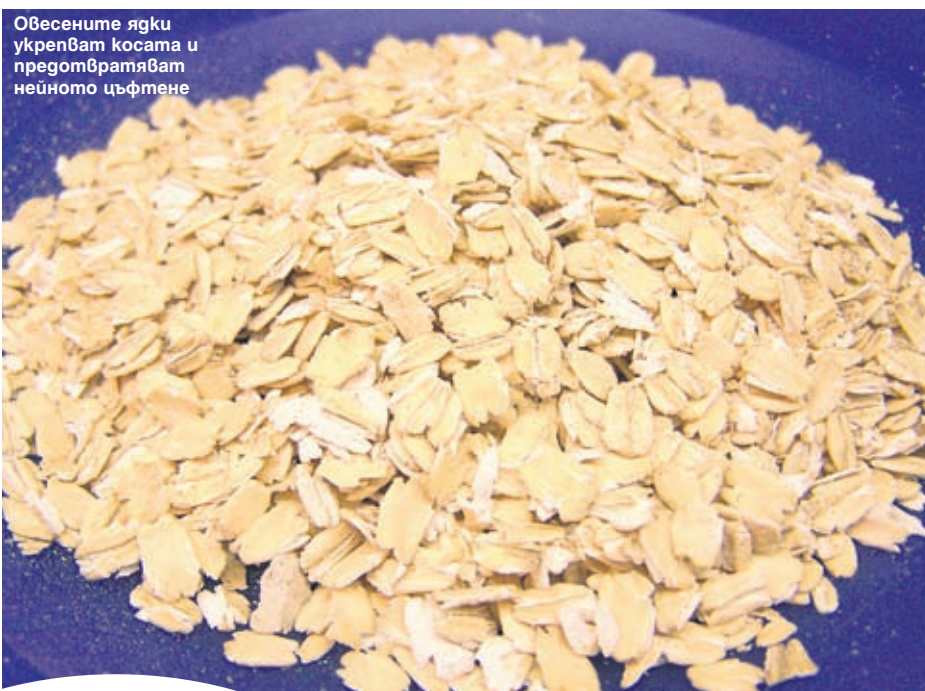
Овесените ядки укрепват косата и предотвратяват нейното цъфтене

Гръцките орехи ще придадат еластичност на кожата ви. Те са богати на витамините А, Е,