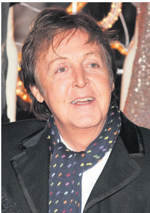
Бившият бийтълс, сър Пол Маккартни, е един от най-гласовитите привърженици на кампанията "По-малко месо, по-малко жеги", която атакува и Европейски парламент

Най-месоядни в света са богатите нации. Победните пък гледат на месото като на престижна храна и дават всеки допълнителен лев за него. В развитите страни на глава от населението годишно се падат по 80 кг месо (в САЩ и Канада - 121 кг), 26 кг риба, 201 литра мляко и произведени от него продукти и 414 кг