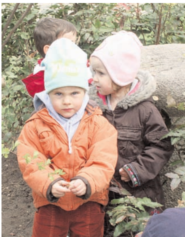
Ако детето ви изговаря неправилно някои гуми, винаги трябва да го поправяте, за да свикне с тяхното правилно произношение

Често дефектите може да се преодолеят в ранна възраст