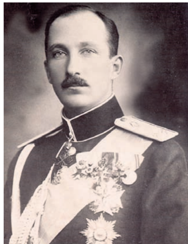
Цар Борис III

30 август 1040 г. - Започва въстание за освобож-