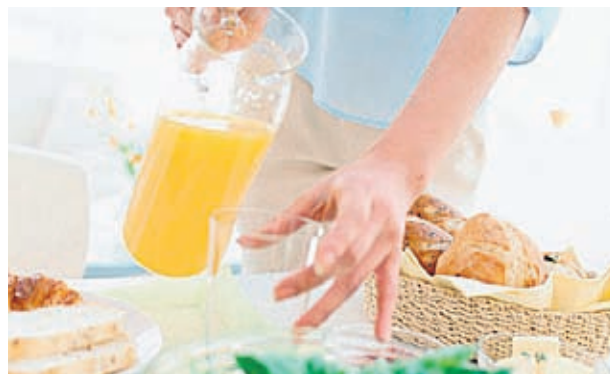
Балансираното хранене е един от основните стълбове, зелегнали в програмата „Витал“

Специалистите от балнеоцентъра акцентират върху висока двигателна активност, добре балансирано хранене и лич-