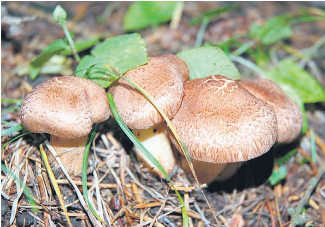
Много от отровните гъби са изключително вкусни и по време на консумация с нищо не подсказват за вредното си съдържание

Има и други отровни гъби, но зелената и бялата мухоморка са особено