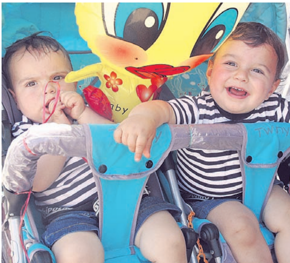
Близнаците носят двойна радост във всяко семейство, но често многоплодната бременност е свързана със сериозни медицински усложнения

Повишената успеваемост и осигуреното фи-