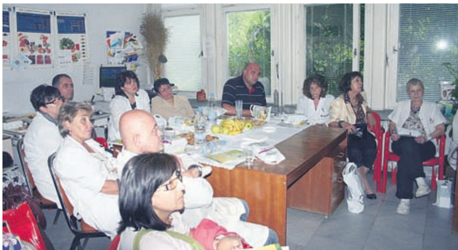
Обучителен семинар на „Брандекс България“, София, по програмата „Botanic“