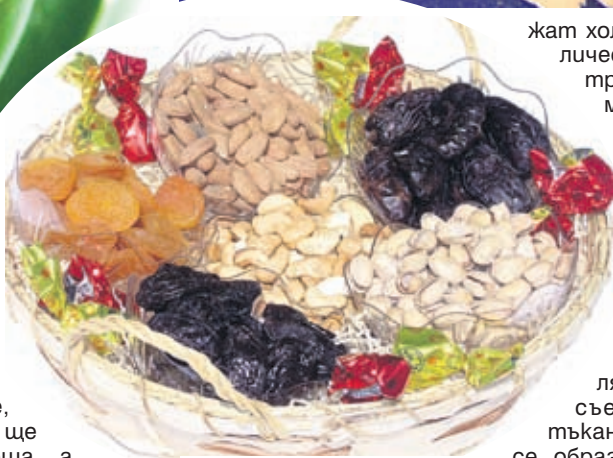
Ядките са универсален разкрасителен помощник

В, Р, С, минерални вещества (калий, натрий, фосфор, желязо, магнезий, калций, йод). Гръцките орехи съдържат около 60% мазнини, но повечето от тях са ненаситени и практически не съдър-