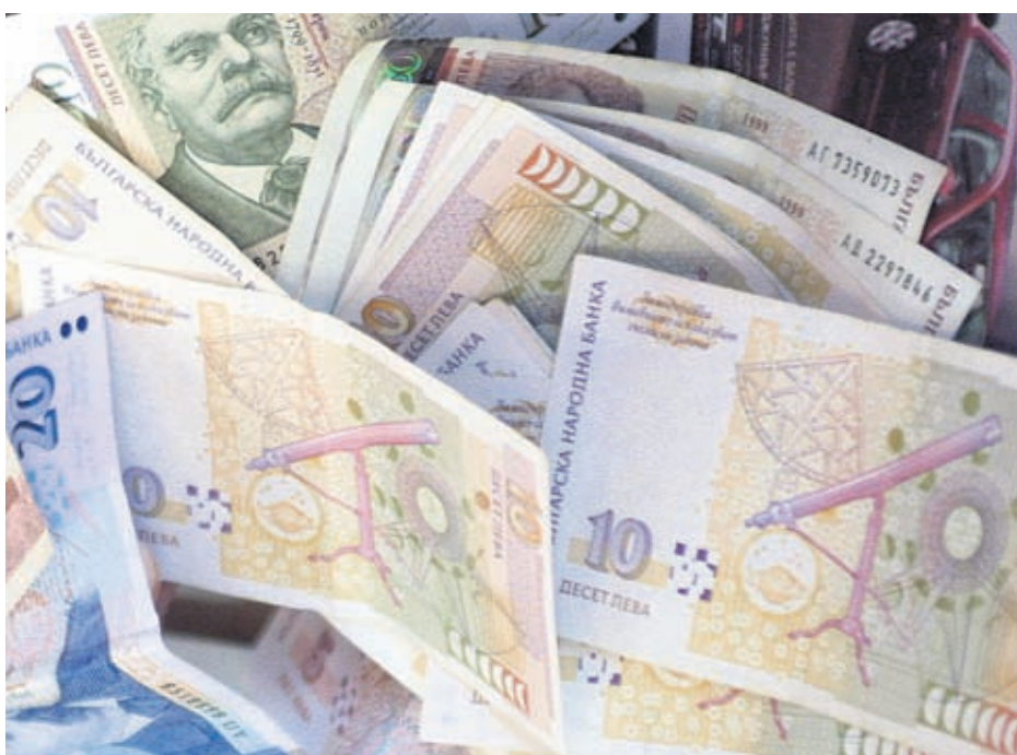
Банкнотите са по-опасни за човешкото здраве, защото върху монетите бацилите не се задържат дълго

Историята на финикийските знаци е изпъстрена с любопитни факти. Предлагаме ви някои от тях.