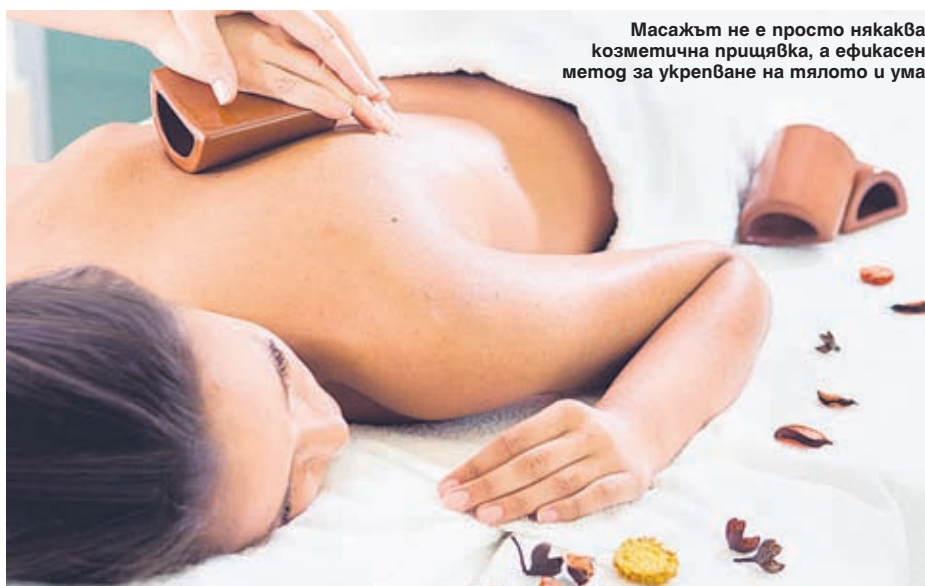
Масажът не е просто някаква козметична прищипка, а ефикасен метод за укрепване на тялото и ума

Рискът да попаднете в ръцете на непрофесионалист е голям. Той може не само да не ви помогне, но и да ви навреди. Ако на плажа или в сауната се използват прийоми на мануалната терапия, това е повод за тревога. Мануалният масаж е много сложно лечение. Първо се поинтересувайте дали масажистът има лиценз и към кой център работи. Не икономисвайте пари от масажа. Поверете здравето си на професионалист.