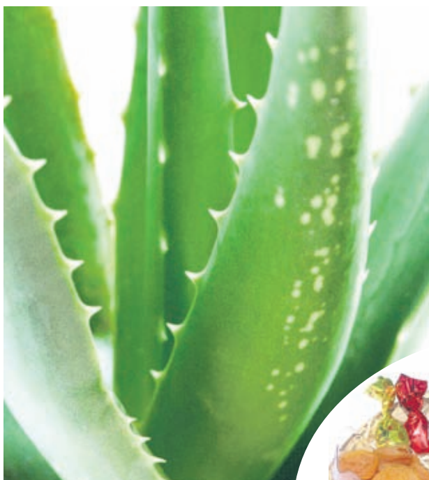
Алоето е най-добрият приятел на кожата

Даровете на природата са неизчерпаем източник не само на здраве, а и на красота. Но за да ги ползваме ефективно, трябва да знаем кои са те и как действат върху нашия организъм.