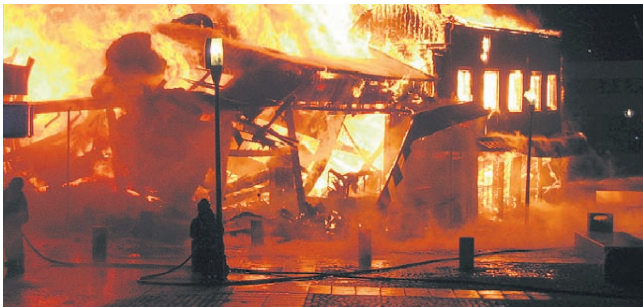
Огнената стихия често е напълно опустошителна, а борбата с нея - тежка и опасна

Пожарът може да бъде предизвикан от електрически неизправности, инциденти при готвене, из-