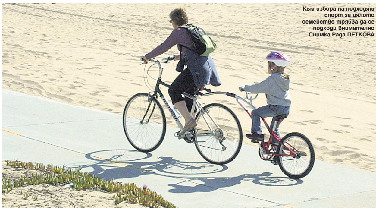
Към избора на подходящ спорт за цялото семейство трябва да се подходи внимателно

Доц. д-р Евгений Медникаров Основното е всеки да намери своя баланс, който трябва да е съобразен с природните му дадености, възрастта, общото състояние. И двете крайности са вредни - обездвижването, в чиито плен са огромната част от съвременните хора, и прекалените натоварвания, които могат да причинят различни проблеми. Препоръчвам редовното умерено натоварване със спортове, които ни носят удоволствие, без да гоним някакви големи постижения. В съвременния живот е много важно да се опитваме да заменяме дългия престой пред телевизора или компютъра с няколко часа движение сред природата или колективна игра на открито с приятели, независимо дали е футбол